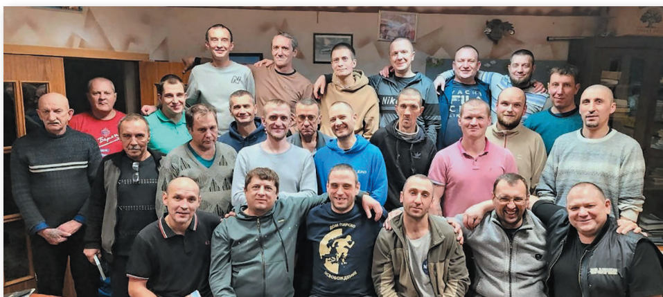
Нас посещают выпускники и участвуют в жизни центра

Я очень хотел остановиться. Я устал бегать, страдать и умирать! Надеюсь, Господь меня слышит, простит и даст сил для новой жизни во Христе! А я со своей стороны доверяю Ему свое прошлое, настоящее и будущее!